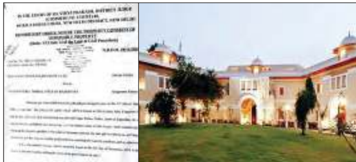
मॉर्निंग न्यूज़ @ जयपुर

नोखा नगरपालिका ने ठेकेदार को नहीं दिए थे रुपए, कॉर्पोरेशन कोर्ट ने दिए प्रॉपर्टी अटैच के आदेश