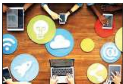
मॉर्निंग न्यूज़ @ जयपुर

10 करोड़ का टैंडर निकाला, एजेंसी को हर माह 5 प्रतिशत फॉलोअर बढ़ाने होंगे