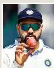
पेज 7 | स्पোর্ट्स

साल के अंतिम गुरु पुष्य नक्षत्र पर गणेश मंदिरों में... | 3